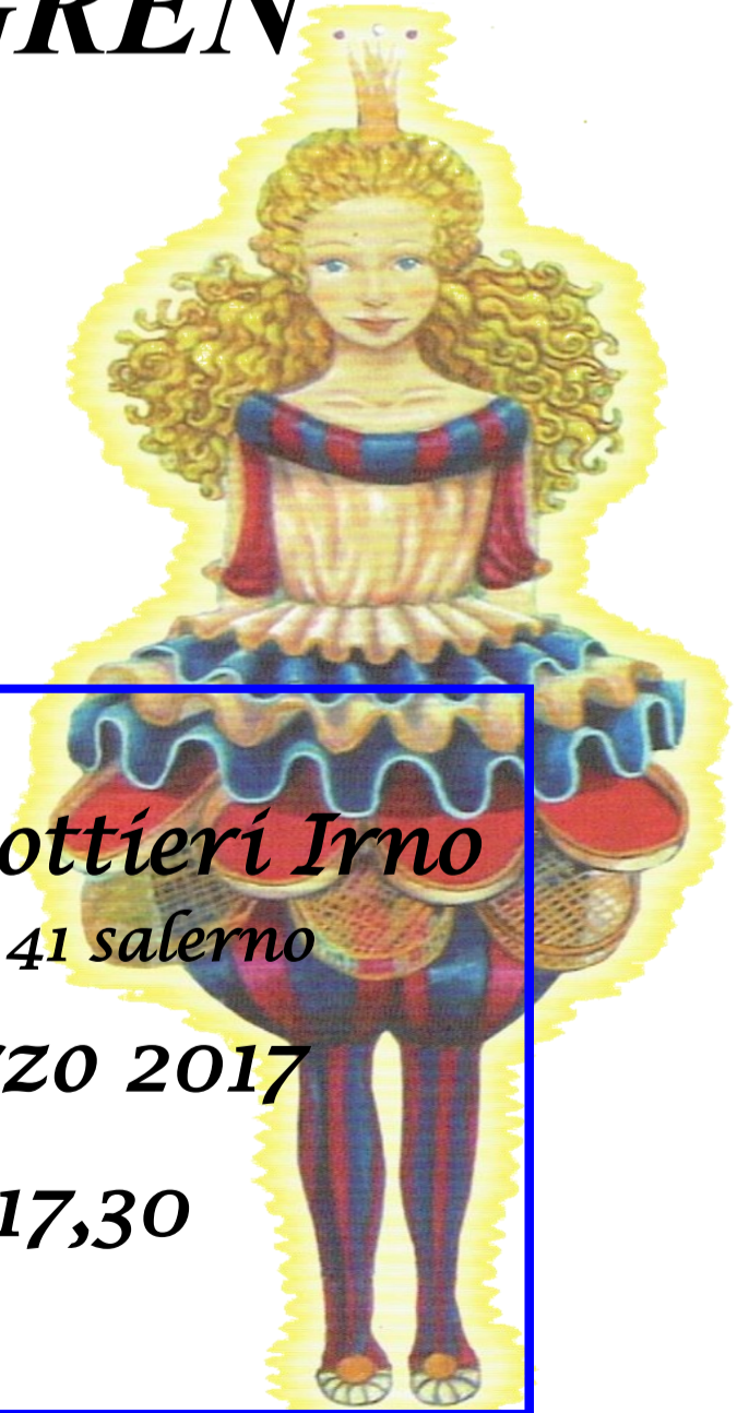
la Principessa Luce